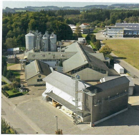
Wangen-Schauwies ist der Standort von Rohstoffhandel, Ölmühle und Verwaltung.

Platz für rund 1.500 Europaletten. Darauf lagern verpackte Getreide, Hülsenfrüchte wie Erbsen und Linsen, Saaten und Futtermittel, aber auch Proteinnmehle und Ölkuchen, die bei der Pressung von Nüssen, Kernen und Saaten in der Ölmühle entstehen. In der modernen Siloanlage können bis zu 3.000 Tonnen lose Ware zuverlässig erfasst werden, darunter auch Weißzucker, der aus süddeutschen Bio-Zuckerrüben gewonnen wird. Zudem wurden zahlreiche Silozellen geschaffen, in denen verschiedenste gereinigte und vorverarbeitete Rohstoffe in kleineren Gebinden bis zur Verwendung im Backwaren- und Lebensmittelbereich vor äußeren Einflüssen sicher geschützt sind. Dazu gehören zum Beispiel Hafer-, Dinkel- und Hirseflocken, Roggenmalz, Weizenkleie, Buchweizen- und Kürbiskerne, aber auch Spezialprodukte wie Gluten und Stärke.